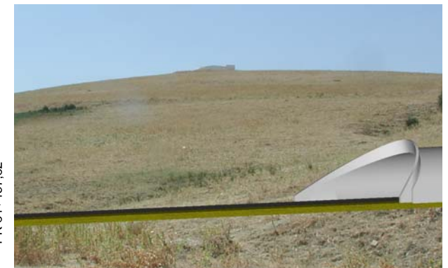
Visualisierung des Westportals